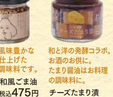
和洋の発酵コロポ、 お酒のお供に。 たっぷり醤油はお料理 の調味料に。 チーズたまり漬 (130g) 税込648円