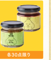
各30点限り 食べるオリーブオイル/ 食べるラー油 (各・110g) 各税込399円