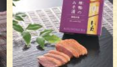
鴨胸のみそ漬 (50g) 税込1,188円