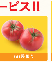
50袋限り トマト (1袋) 税込399円