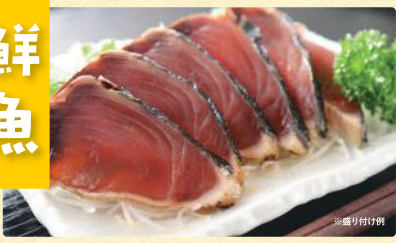
かつおたたき(刺身用・解凍、1パック[1/8尾]) 税込798円