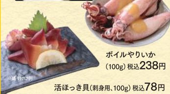
ポイルやりいか (100g) 税込238円