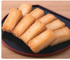
一口厚揚げソフト蒲鉾スティック (1本) 税込60円 (9本) 税込500円