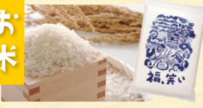
福島県産「福、笑い」(2kg) 税込1,728円 (300g) 税込540円