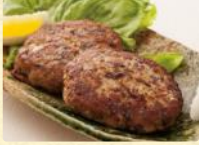
さんまぼーぼー焼き (4個) 税込698円