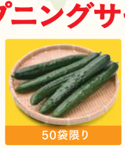
きゅうり (1袋) 税込299円