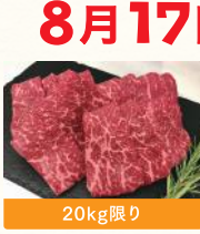
20kg限り 福島県産 ふくしま燻牛 焼肉用切り落とし (100g) 税込780円