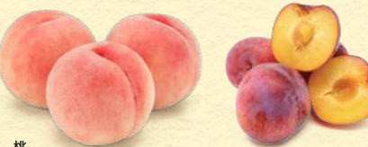
桃 (1パック) [各日50パック限り] 税込1,080円 (1箱) [各日10箱限り] 税込5,000円