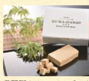
蔵醍醐クリームチーズみそ漬 (75g) 税込1,296円