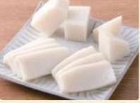
刺身かまぼこ (1パック170g) 税込298円