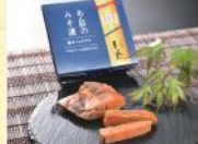
あん肝のみそ漬 (30g) 税込1,188円