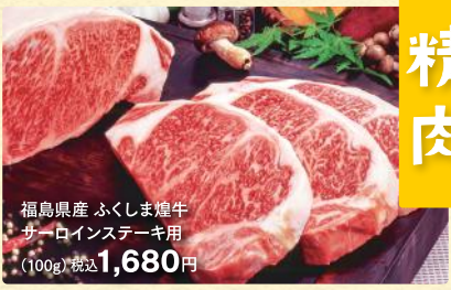
福島県産 ふくしま燻牛 サーロインステーキ用 (100g) 税込1,680円