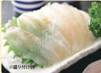
活平目 (刺身用・解凍、100g) 税込498円