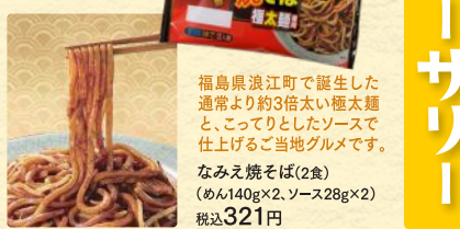
福島県浪江町で誕生した 通常より約3倍太い極太麺と、 こってりとしたソースで 仕上げたご当地グルメです。 なみえ焼そば(2食) (めん140g×2、ソース28g×2) 税込321円