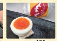
スモッチ(1個) 税込155円