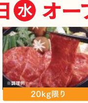
20kg限り 福島県産 ふくしま燻牛 肩ロースすき焼き・焼肉用 (100g) 税込880円