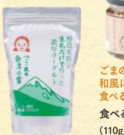
加糖ヨーグルト(1,000g) 税込1,058円 ●加糖ヨーグルト(120ml) 税込194円 ●無糖ヨーグルト(1,000g) 税込950円