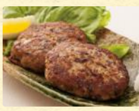
さんまぼーべー焼 (4個) 税込698円