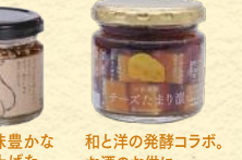
和洋の発酵コラボ。 お酒のお供に。 たまり醤油はお料理 の調味料に。 チーズたまり漬 (130g) 税込648円