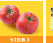
トマト (1袋) 税込399円