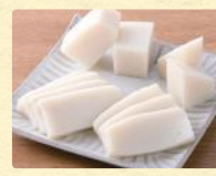
刺身かまぼこ (1パック170g) 税込298円