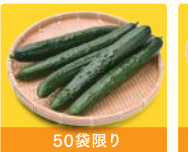
きゅうり (1袋) 税込299円