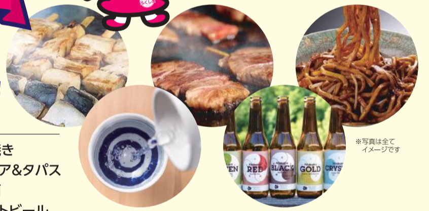
*写真は全てイメージです