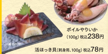
ボイルやりいか (100g) 税込238円