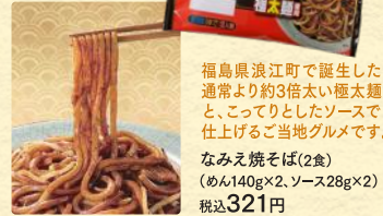
福島県浪江町で誕生した 通常より約3倍太い極太麺と、 こってりとしたソースで 仕上げるご当地グルメです。 なみえ焼そば(2食) (めん140g×2、ソース28g×2) 税込321円