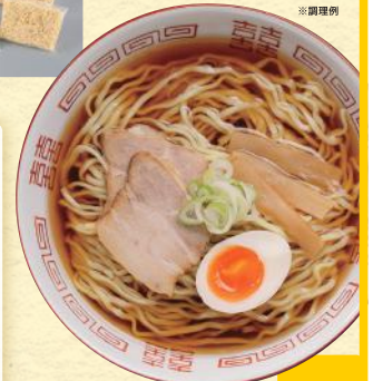
具付 喜多房醤油ラーメン(2食) 1セット(生麺120g×2、醤油スープ 35g×2、チャーシューメンマ33g×2、 フリーズドライネギ1g×2) 税込880円