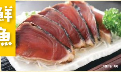
かつおたたき(刺身用・解凍、1パック[1/8尾]) 税込798円