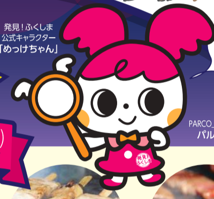
発見!ふくしま公式キャラクター「めっけちゃん」

他にも、多彩なゲストやキャラクター着ぐるみショーなどステージイベントもりだくさん!