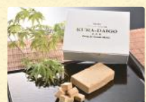
蔵醍醐クリームチーズみそ漬 (75g) 税込1,296円