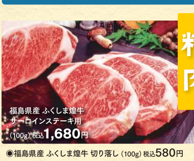
福島県産 ふくしま焼牛 サーロインステーキ用 (100g) 税込1,680円 ●福島県産 ふくしま焼牛 切り落とし (100g) 税込580円