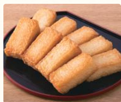
一口厚揚げソフト蒲焼スティック (1本) 税込60円 (9本) 税込500円