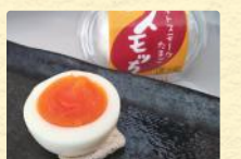
スモチ (1個) 税込155円