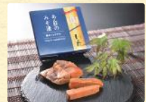
あん肝のみそ漬 (30g) 税込1,188円