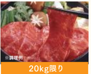
福島県産 ふくしま焼牛 肩ロースすき焼き・焼肉用 (100g) 税込880円