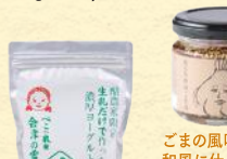
ごまの風味豊かな 和風に仕上げた 食べる調味料です。 食べる和風ごま油 (110g) 税込475円