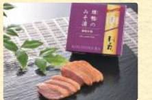
燻鴨のみそ漬 (50g) 税込1,188円