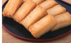
一口厚揚げソフト蒲焼スティック (1本) 税込60円 (9本) 税込500円