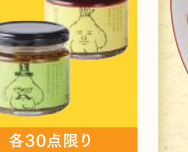
食べるオリーブオイル/ 食べるラー油 (各・110g) 各・税込399円