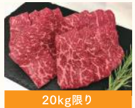
福島県産 ふくしま焼牛 焼肉用切り落とし (100g) 税込780円